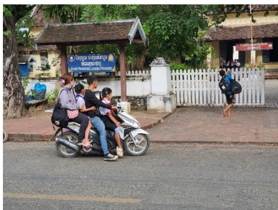
Ecole primaire : Tiers-lieu du quartier Xiengthong

Hongkham ancre son action sur l'école Primaire / Classes bilingues Lao-Français de Luang Prabang qui devient le " Tiers-lieu " du quartier Xiengthong (où est niché le Vat du même nom avec son arbre de vie) qui va devenir le quartier pilote Oui Ensemble .