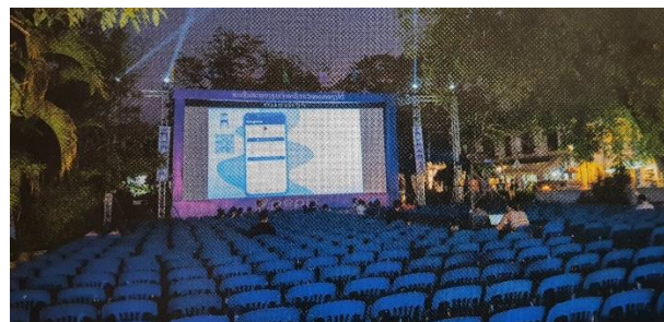
La cour de l'école primaire de Luang Prabang a été utilisée pour la projection de films et de courts métrages pendant le Festival Blue Chair , organisé du 5 au 9 décembre 2024 entre 9 pays d'Asie du Sud Est ...